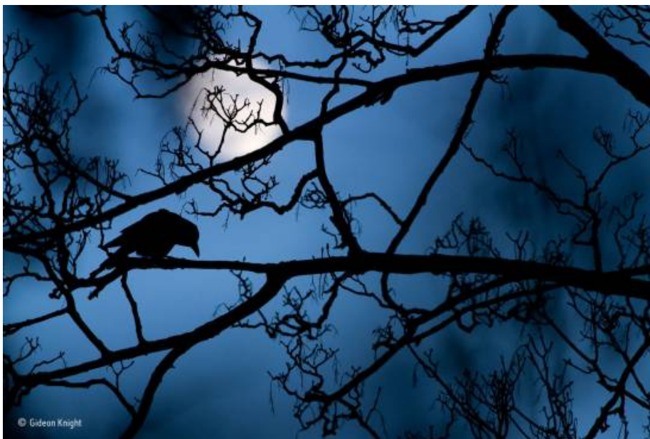
La luna y el cuervo, de Gedeón Knight (Reino Unido). Un cuervo en un árbol en el Parque de San Valentín de Londres / © Gideon Knight

La fotografía la tomó cerca de su casa de Londres y muestra las ramas de un árbol y la silueta del ave con un fondo de cielo azul oscuro y la luna llena. “Esto hace que se parezca casi sobrenatural, como algo salido de un cuento de hadas”, apuntó Gideon.