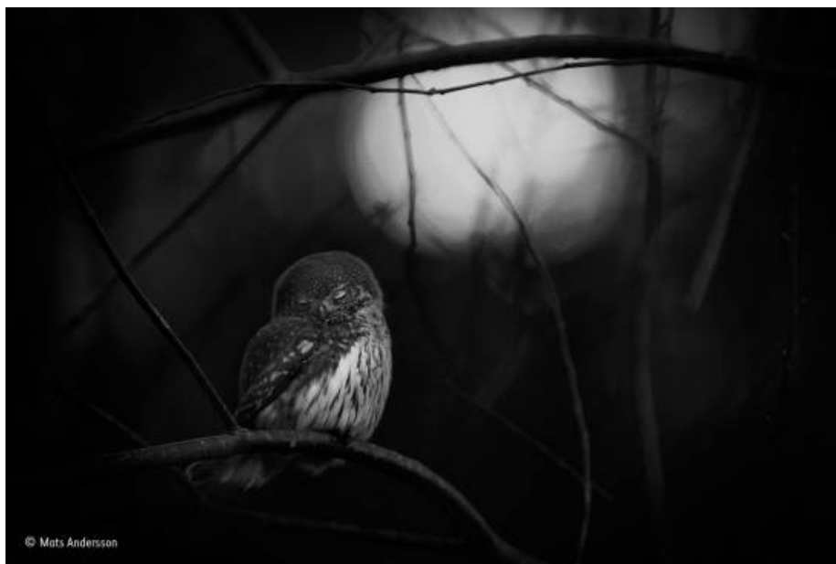
Fotografía ganadora de la categoría blanco y negro

preguntas de la sociedad y el medio ambiente: ¿Cómo podemos proteger la biodiversidad? ¿Podemos aprender a vivir en armonía con la naturaleza? Las imágenes ganadoras tocan nuestros corazones, y nos retan a pensar de forma diferente sobre el mundo natural”.