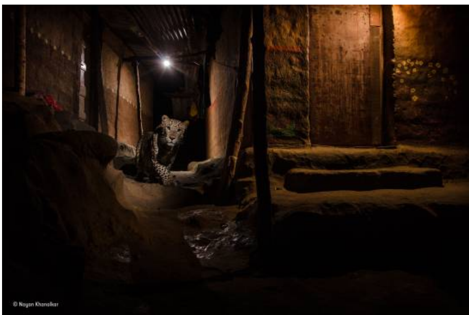
Instantánea galardonada en la sección de paisajes urbanos

La fotografía la tomó cerca de su casa de Londres y muestra las ramas de un árbol y la silueta del ave con un fondo de cielo azul oscuro y la luna llena. “Esto hace que se parezca casi sobrenatural, como algo salido de un cuento de hadas”, apuntó Gideon.